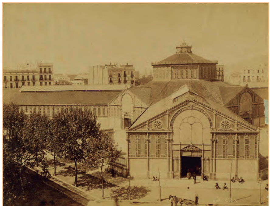
FIGURA 3. Mercat de Sant Antoni.

Els estudis interdisciplinaris aplicats al proveïment alimentari barceloní,