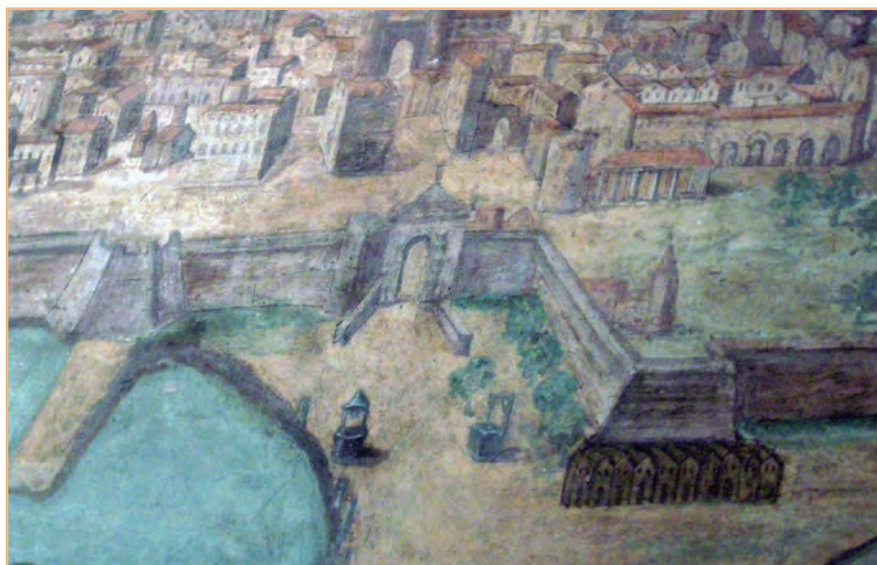
FIGURA 2. La peixateria i les barraques de pescadors. Detall de l'arribada de Sant Ramon de Penyafort a Barcelona, de Giovanni Ricci da Novara, c. 1600. Es pot veure la peixateria al costat de la Torre Nova, el baluard de Migdia i les barraques de pescadors a la platja.

Però, al segle XIX, una ciutat industrial com Barcelona no es podia